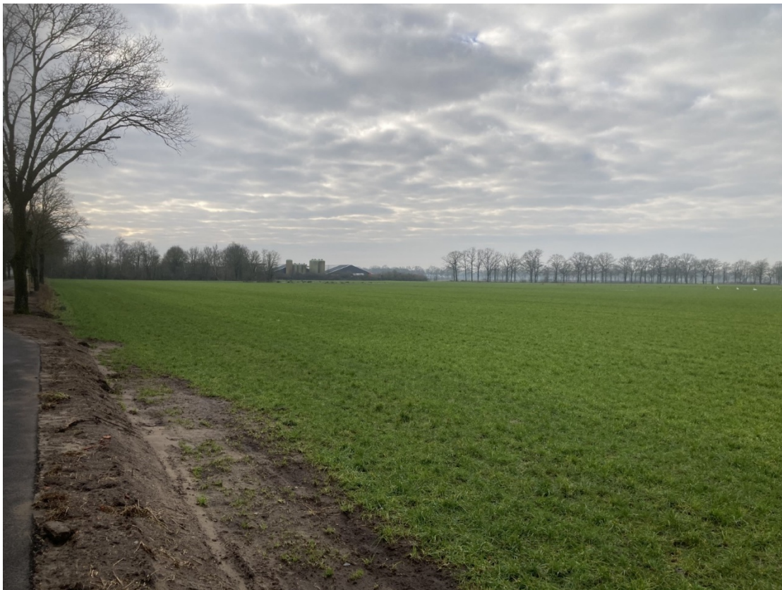
Perceel Hilvarenbeek Q 1218 Januari 2025