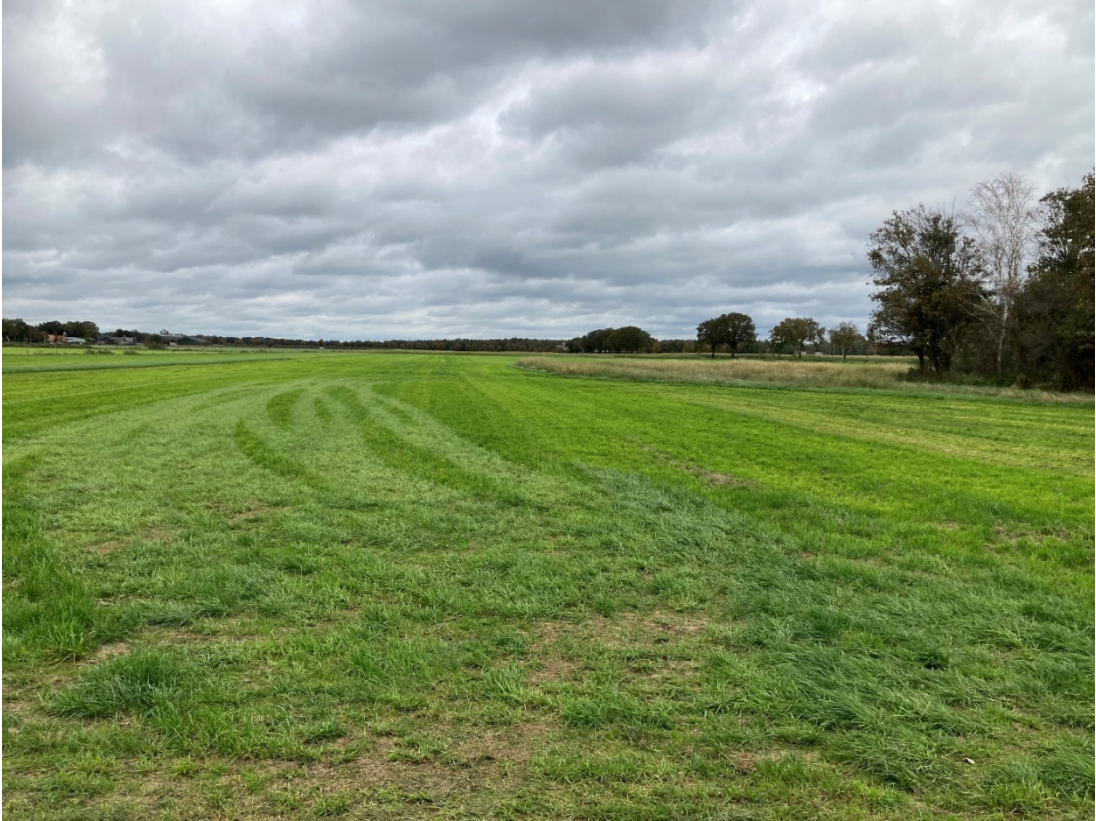
Perceel Hilvarenbeek Q 1218 Zuidzijde Grasland 2024