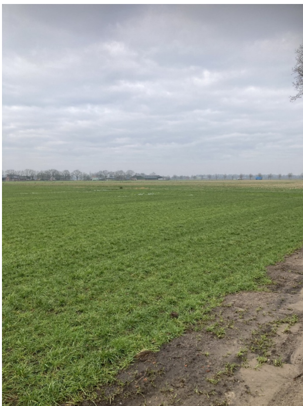
Percelen Hilvarenbeek Q 1217 en 1218 Januari 2025