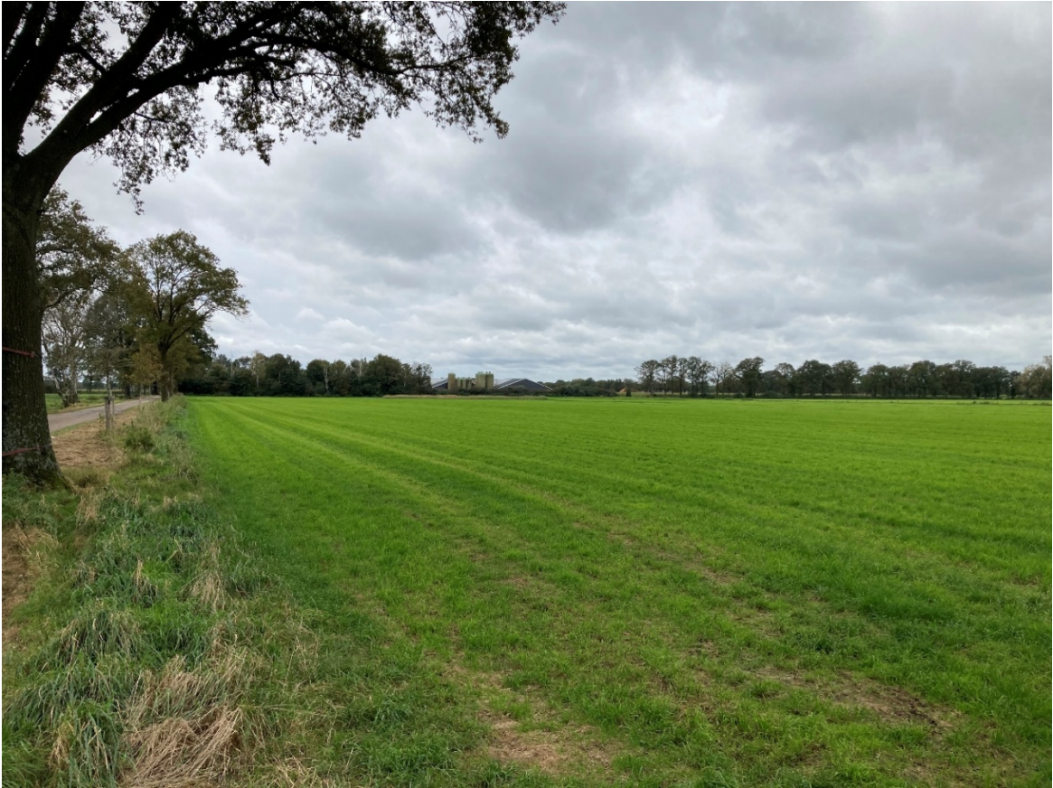
Perceel Hilvarenbeek Q 1218 Grasland 2024