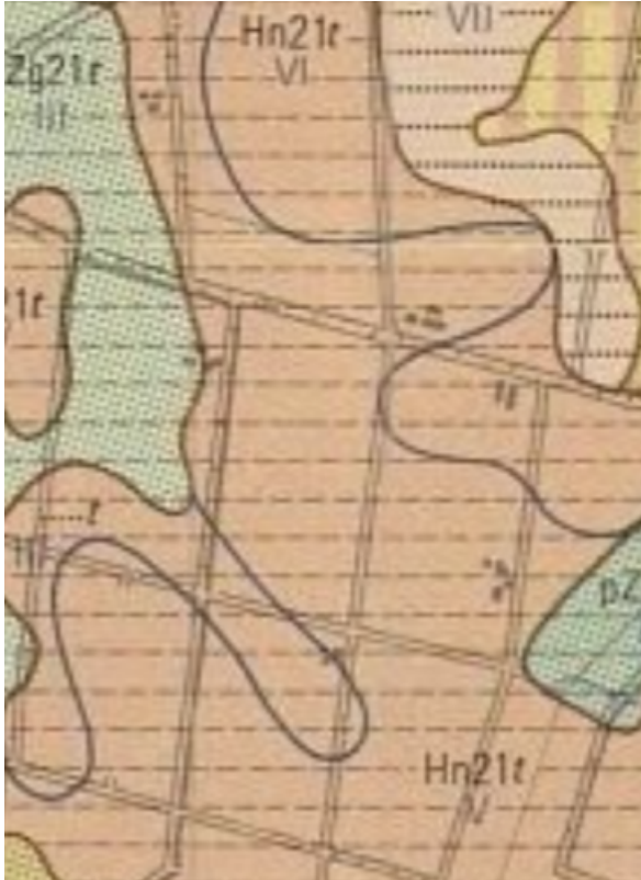
Hn21t V veldpodzolgronden met grondwatertrap V

Bodemkaart en grondwatertrappenkaart