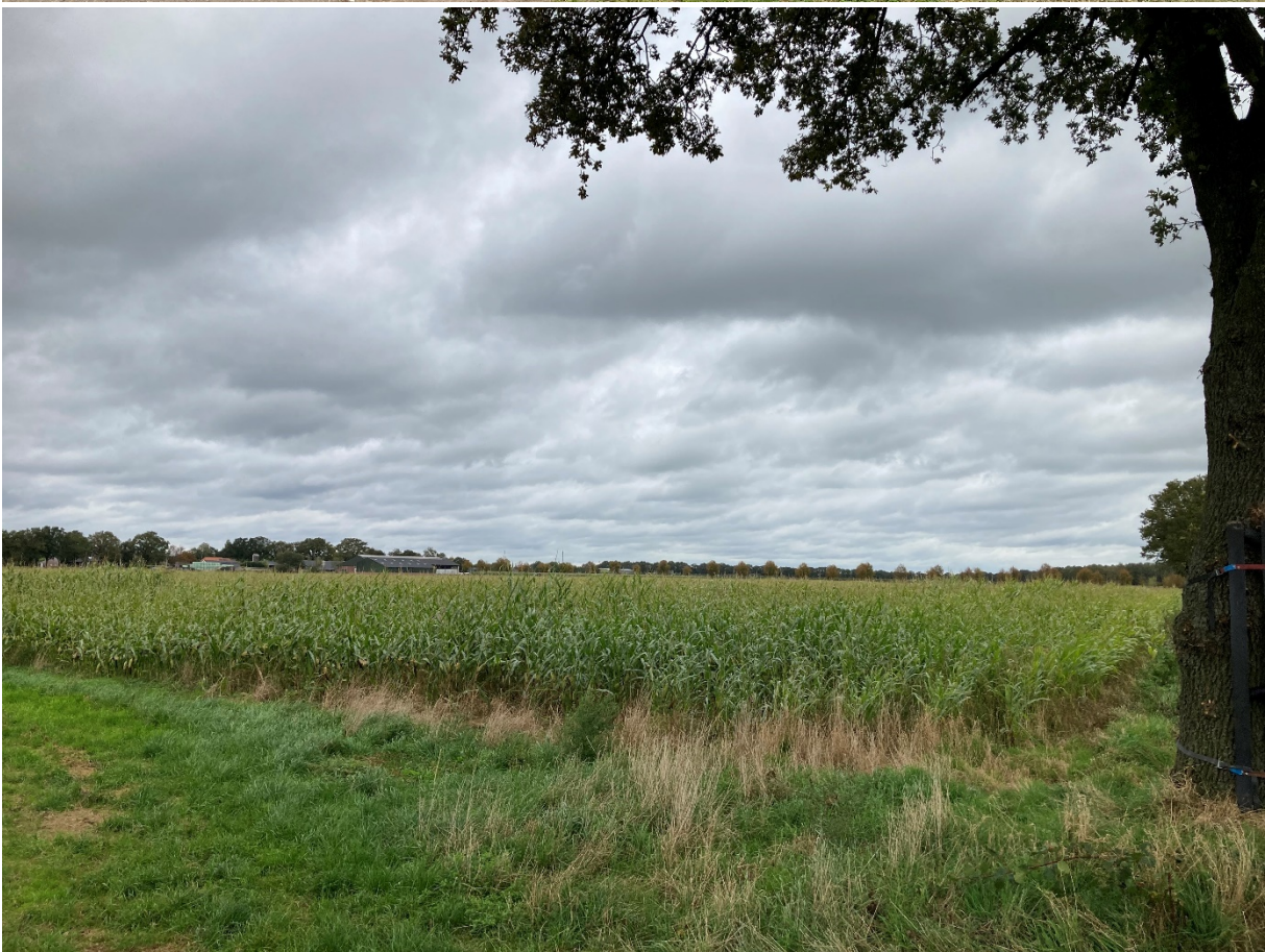
Perceel Hilvarenbeek Q 1220 Maisteelt 2024