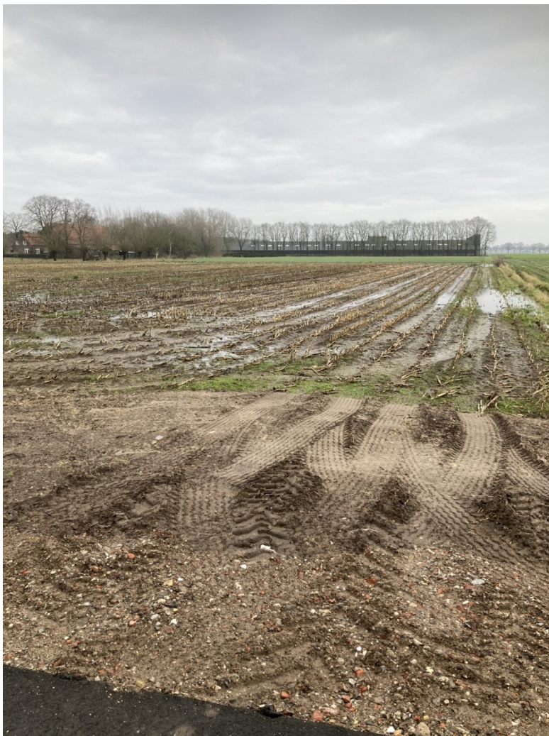
Perceel Hilvarenbeek Q 1220 Januari 2025