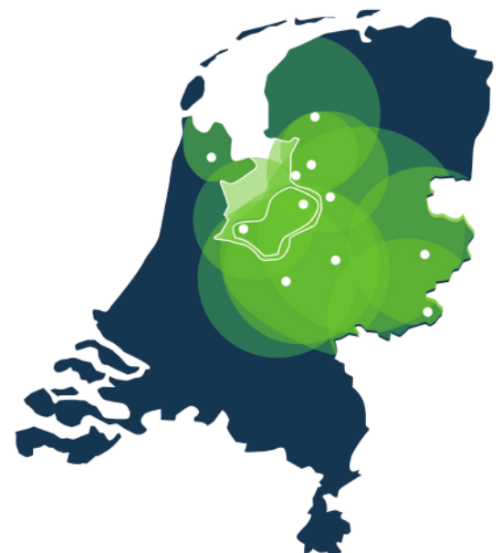
Een uitgestrekt werkgebied met een duidelijke focus