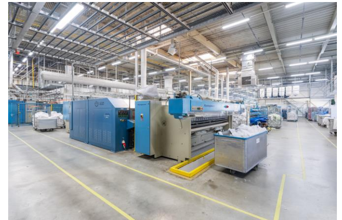
Vossenkoog 5-7 te Alkmaar