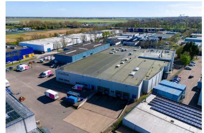
Vossenkoog 5-7 te Alkmaar