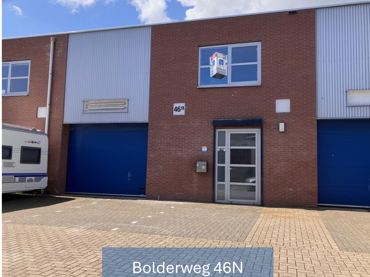
Bolderweg 46N Almere