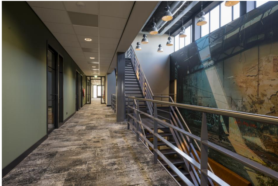
Gang eerste verdieping