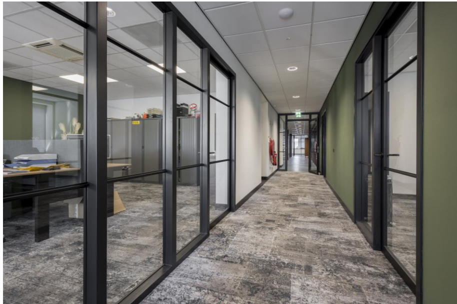
Voorbeeld voor indeling 2e verdieping