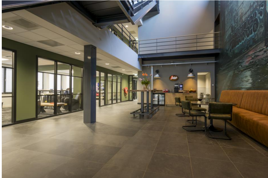
Wachtruimte in de hal op begane grond