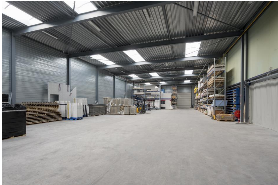
Bedrijfshal begane grond