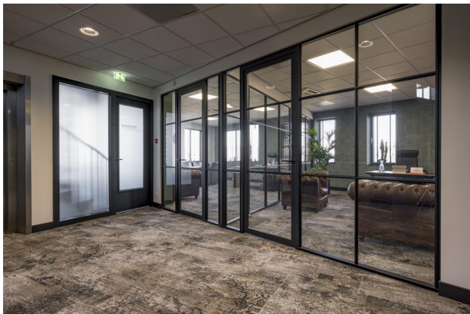
Voorbeeld voor indeling 2e verdieping