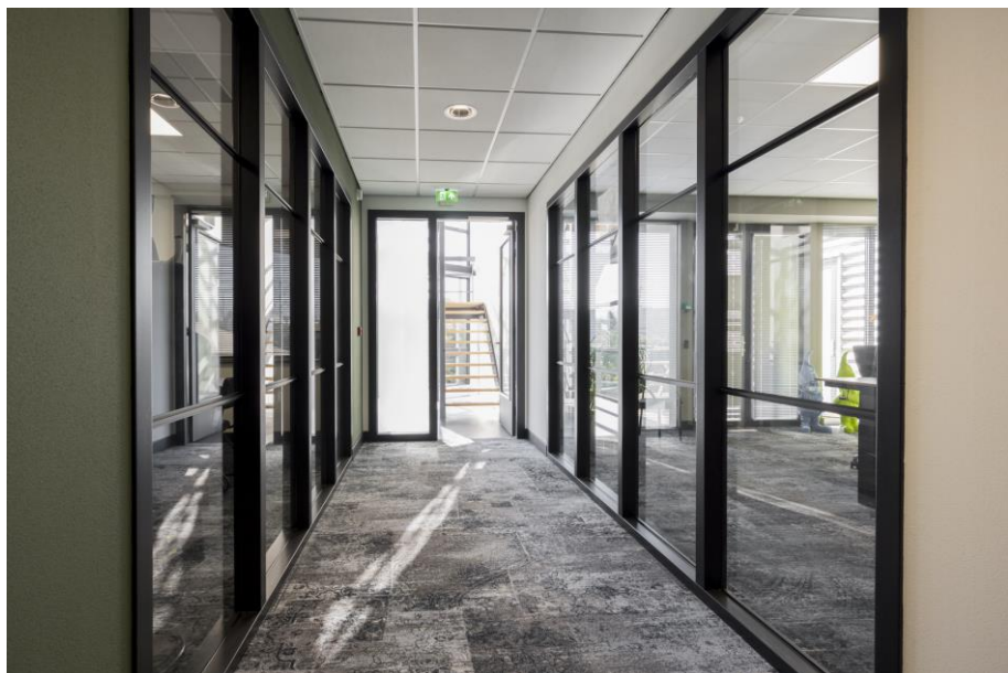
Voorbeeld voor indeling 2e verdieping