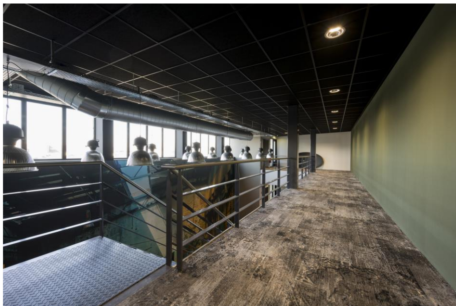
Gang tweede verdieping