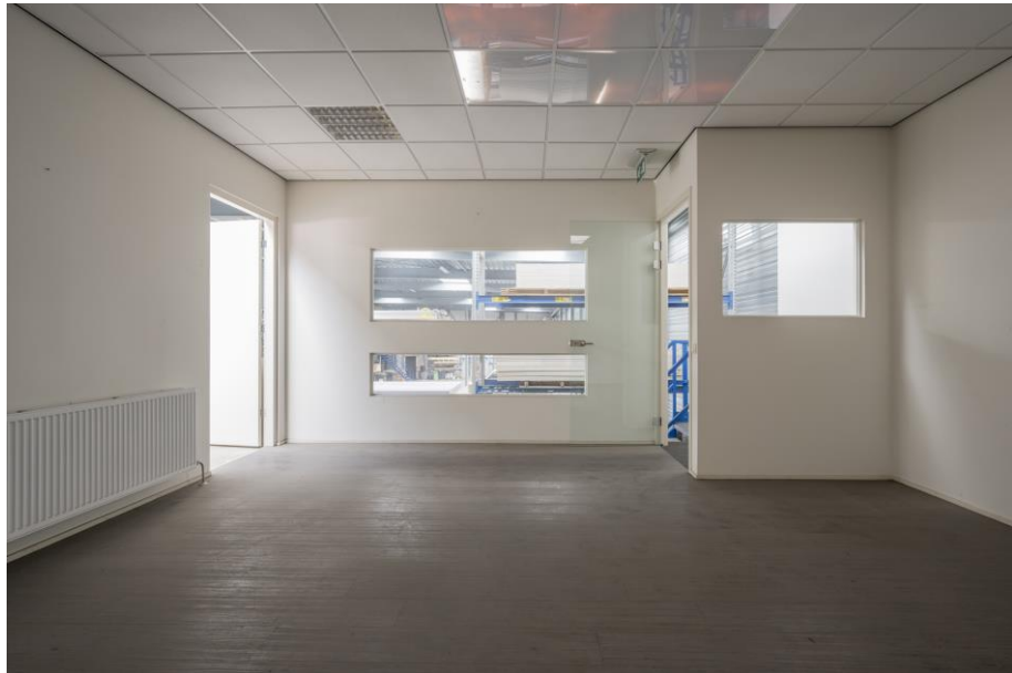
Inpandige kantoorruimte hal begane grond