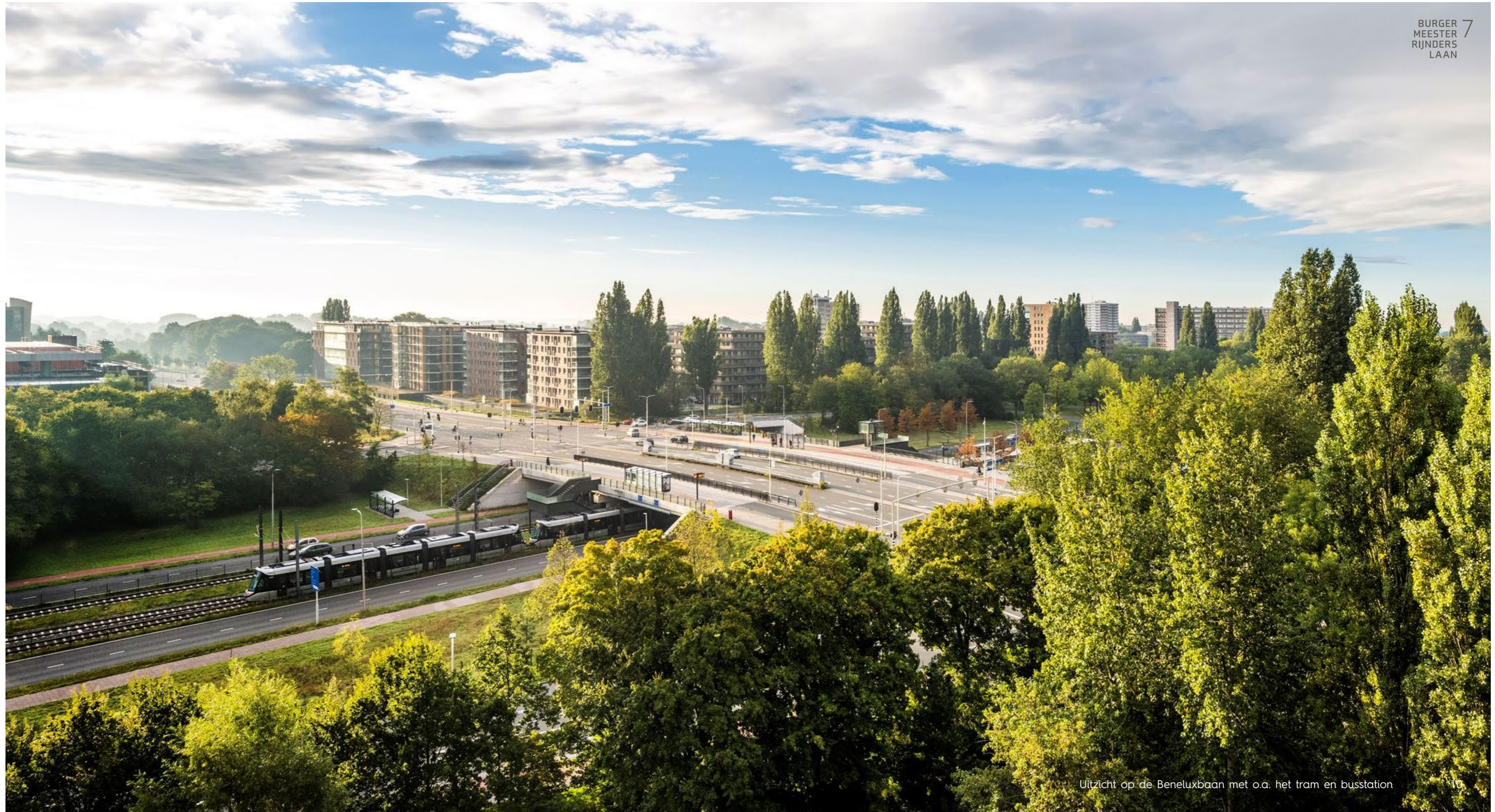
Uitzicht op de Beneluxbaan met o.a. het tram en busstation