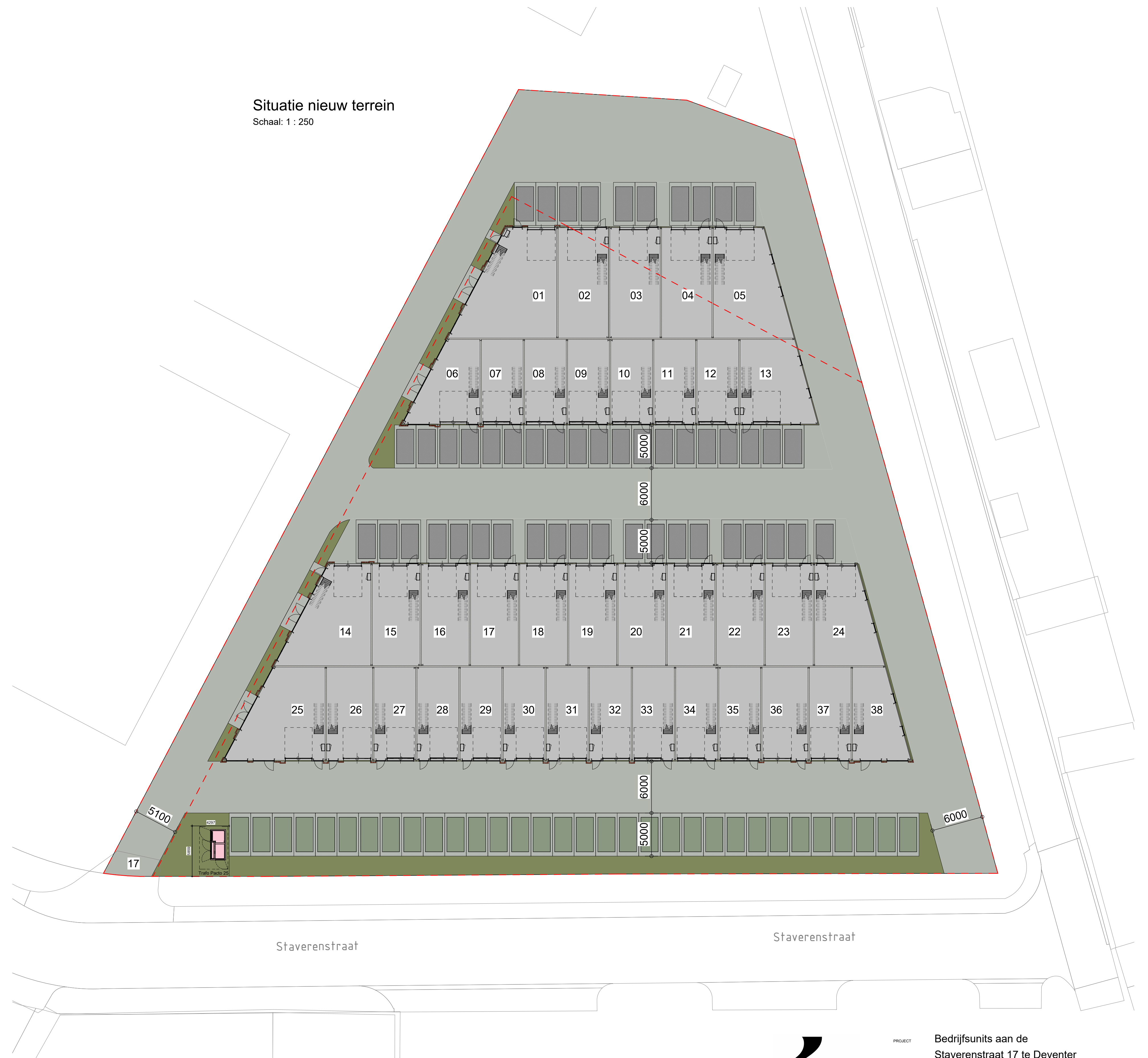
Situatie nieuw terrein Schaal: 1 : 250

Parkeernorm: Bedrijfsverzamelgebouw 1,6 PP / 100m 2 BVO totaal BVO = 5058m 2 ((5058/100)x1,6)= 80,92 81 Parkeerplaatsen, aanwezig 81 parkeerplaatsen Parkeernorm voldoet (voor BVO berekening zie blad DO-801)