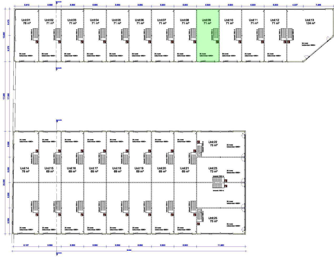
Verdieping fase 1 1:100