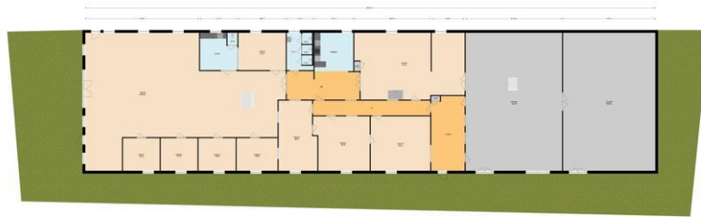
De oppervlakte van deze tekening bedraagt 807 m 2 .