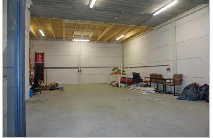
Begane grond met toilet, pantry, meterkast en trapopgang.