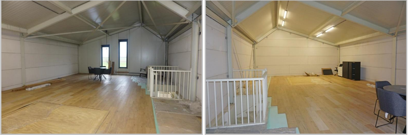
Verdieping (open ruimte) voorzien van een luik.