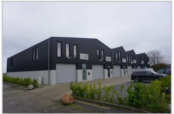
Voor aanzicht met voldoende parkeerplaatsen.