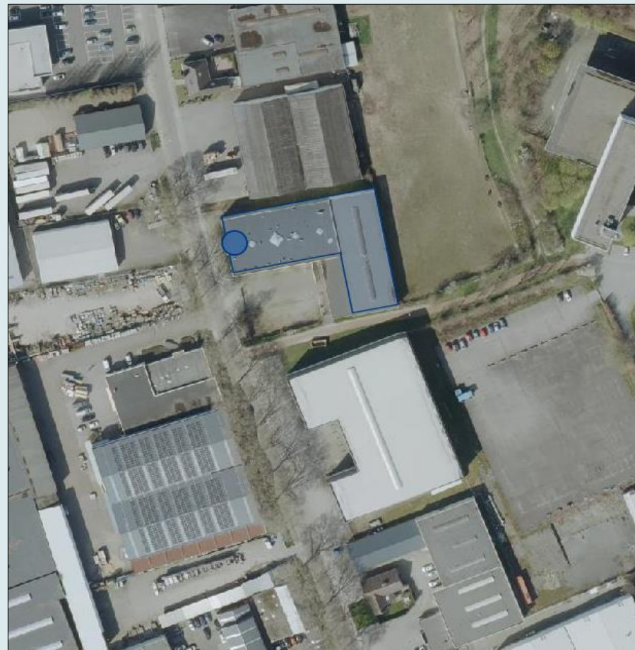
Handelsstraat 15, Sittard