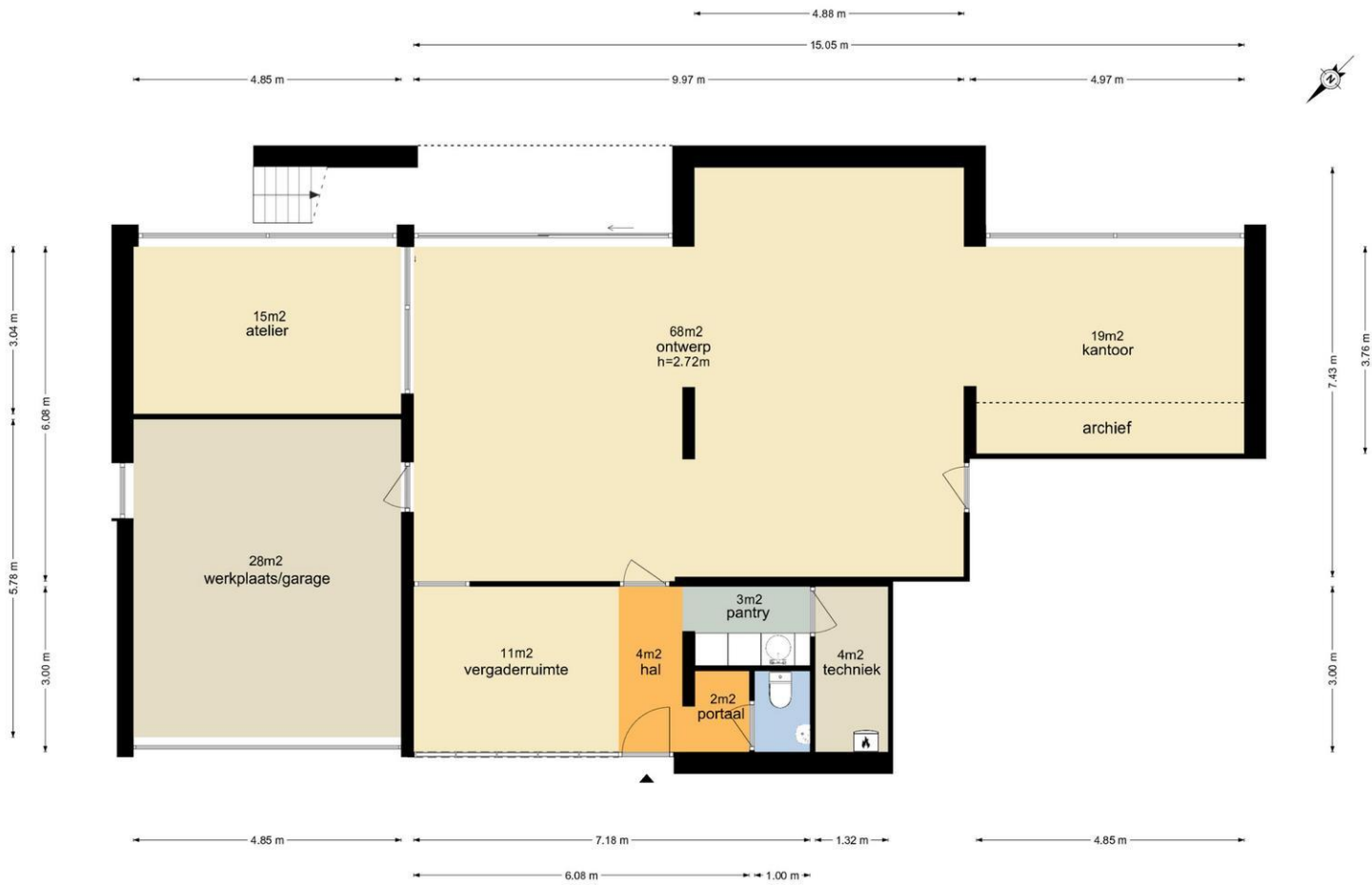
Coenecoop 146 - Waddinxveen Begane Grond

De plattegronden zijn geproduceerd voor promotionele doeleinden en ter indicatie. Aan de plattegronden kunnen geen rechten worden ontleend. © www.vistaview.nl