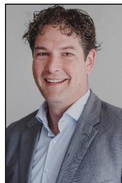
D.R.A. Verlee Kandidaat Register Makelaar Taxateur