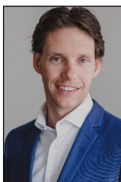
W.G.A Willems Kandidaat Register Makelaar Taxateur