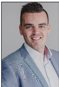
B.J.S.M. Coppes Register Makelaar/ Register taxateur