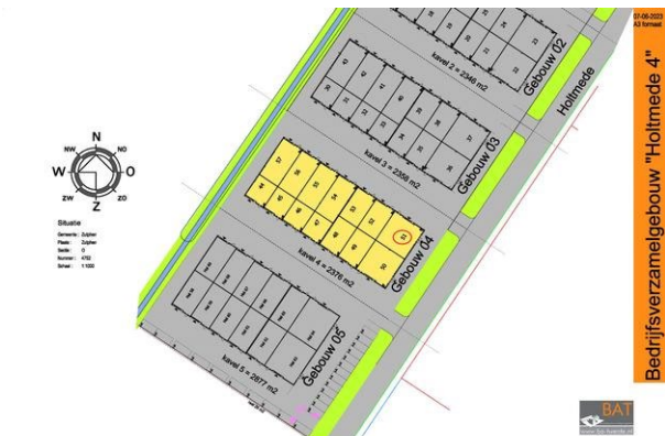
Situatie - locatie 03