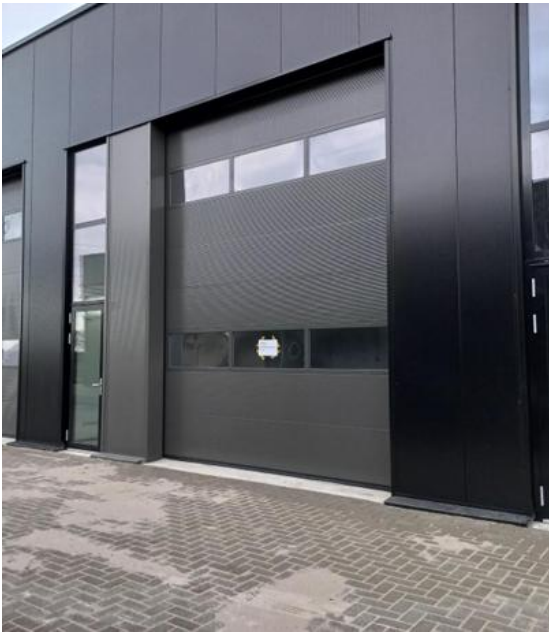
Holtmede 15 c, 7207 BX Zutphen