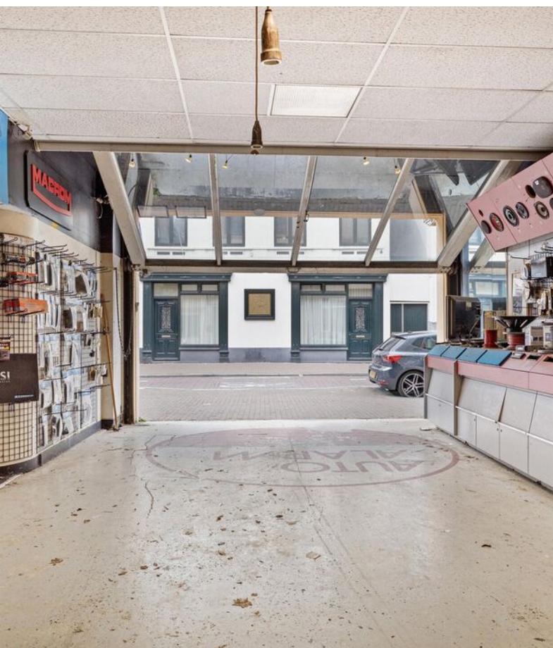
Impressiefoto's Boschstraat 61 (winkelruimte met werkplaats)