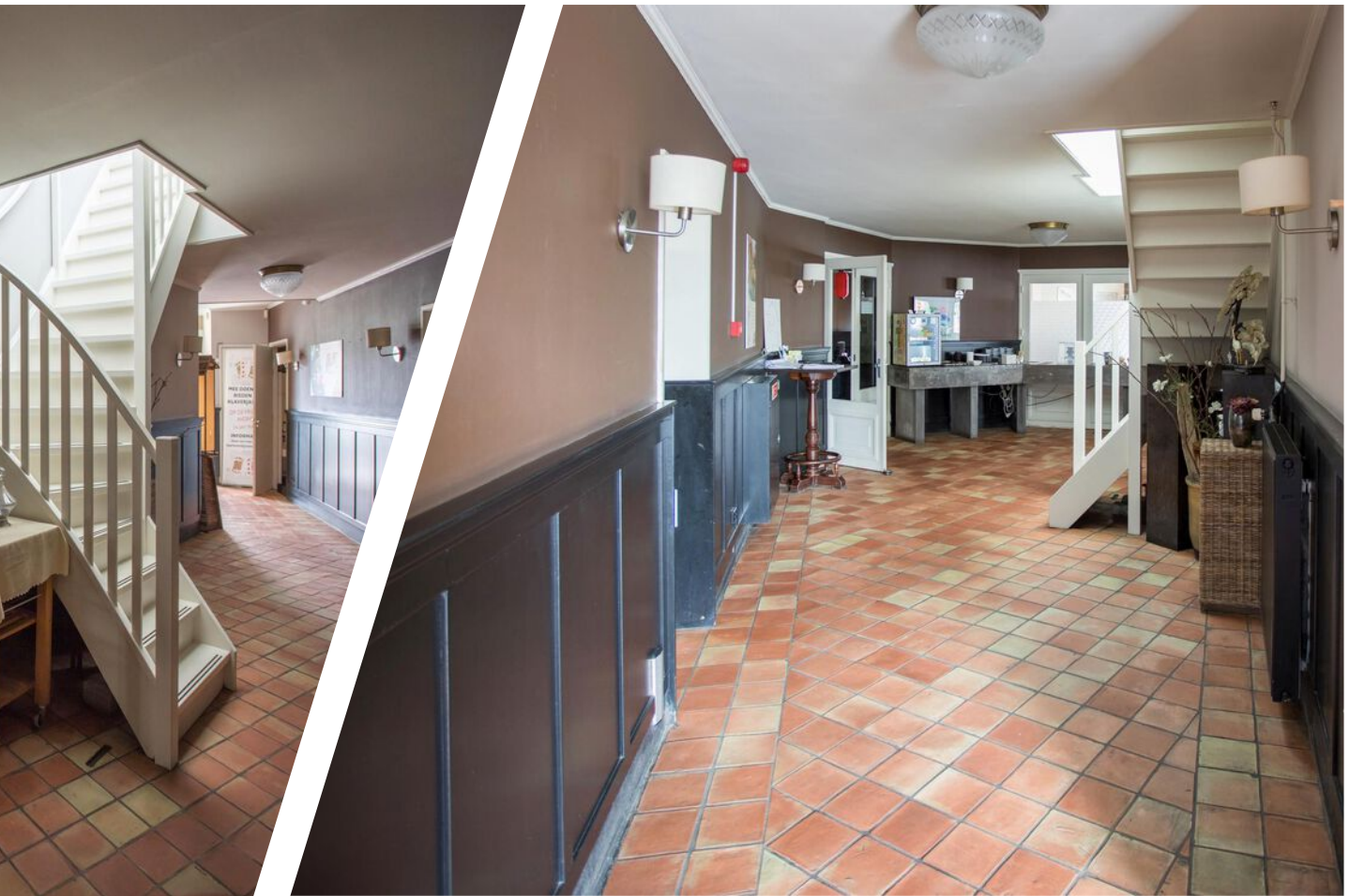
SINKE KOMERJAN BEDRIJFSMAKELAARS