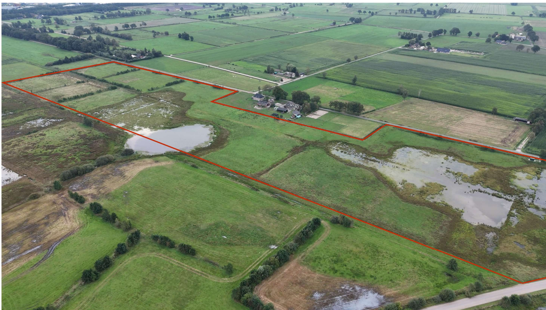
Figuur 3. Rood omlijnde gedeelte (schetsmatig) betreft de percelen te Zunasche Heide

Aan deze kaart kunnen geen rechten worden ontleend.