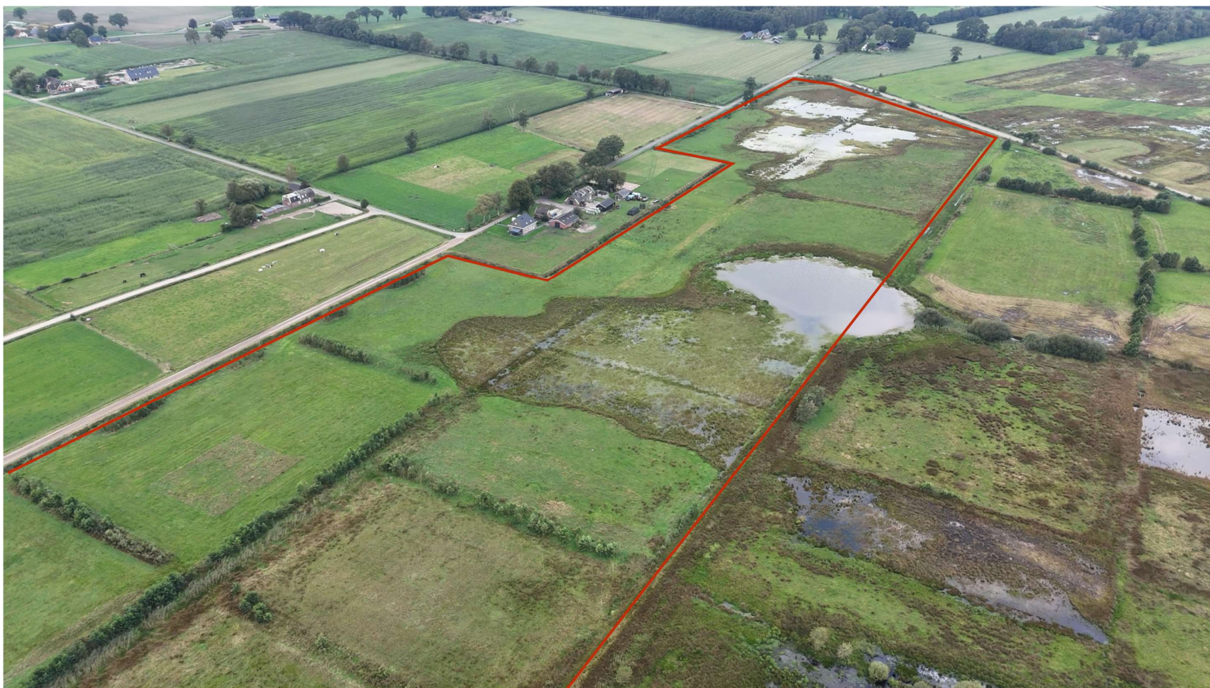
Figuur 3. Rood omlijnde gedeelte (schetsmatig) betreft de percelen te Zunasche Heide

Aan deze kaart kunnen geen rechten worden ontleend.