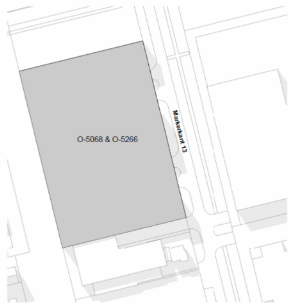
Situatie schaal 1 : 1000

Voorgenomen splitsing in appartementsrechten van de percelen kadastraal bekend: