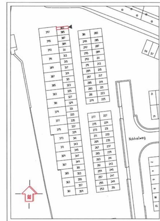
Bijlage 2 Situatietekening