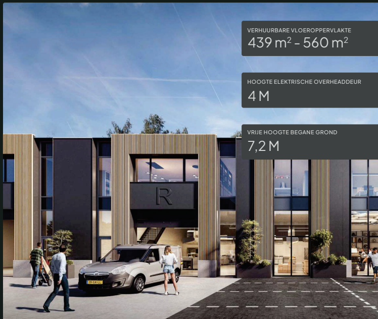
De weergegeven renders zijn indicatief en kunnen afwijken van de werkelijkheid