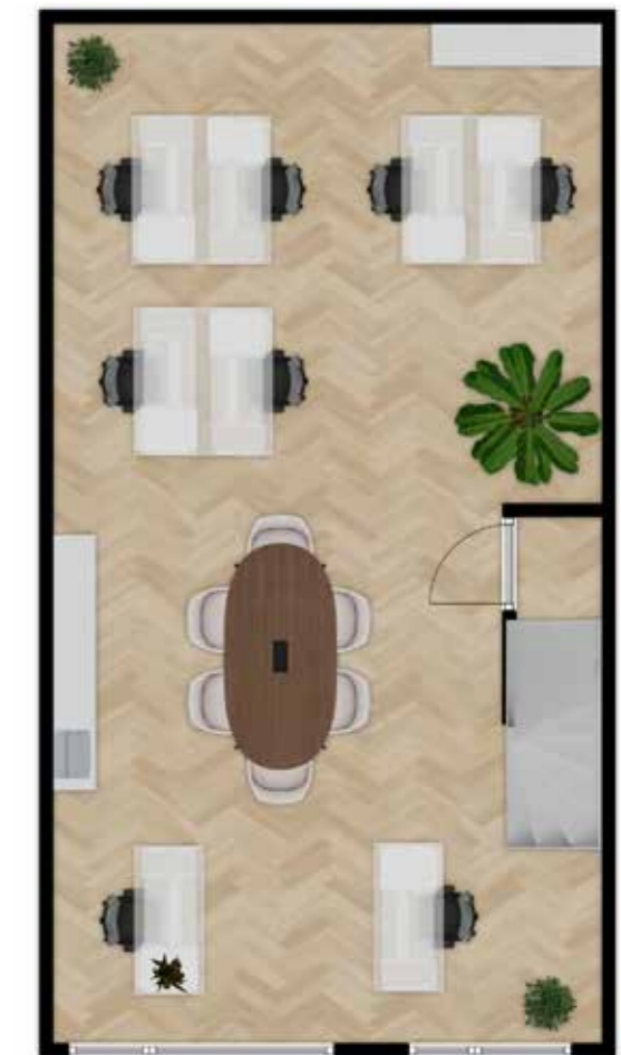
Mogelijke indeling begane grond