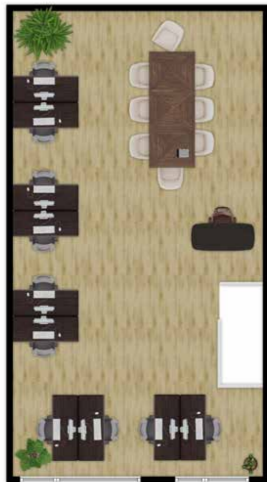
Mogelijke indeling verdieping

JE BENT VRIJ OM JOUW UNIT NAAR WENS IN TE DELEN EN AF TE WERKEN