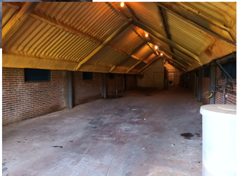
Kleine Heittrak 44 Asten