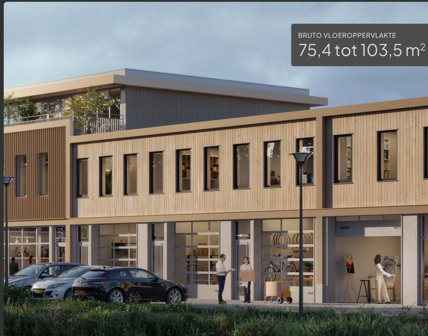
De weergegeven renders zijn indicatief en kunnen afwijken van de werkelijkheid

De tussenunits van type B combineren een moderne uitstraling met praktische functionaliteit. Deze units zijn uitgerust met een elektrische overheaddeur en een separate toegangsdeur, wat zorgt voor gebruiksgemak en flexibiliteit. De betonnen plint op de begane grond geeft de unit een robuuste uitstraling, terwijl de houtlook gevel op de eerste verdieping zorgt voor een stijlvolle en eigentijdse afwerking. Een perfecte mix van functionaliteit en design!