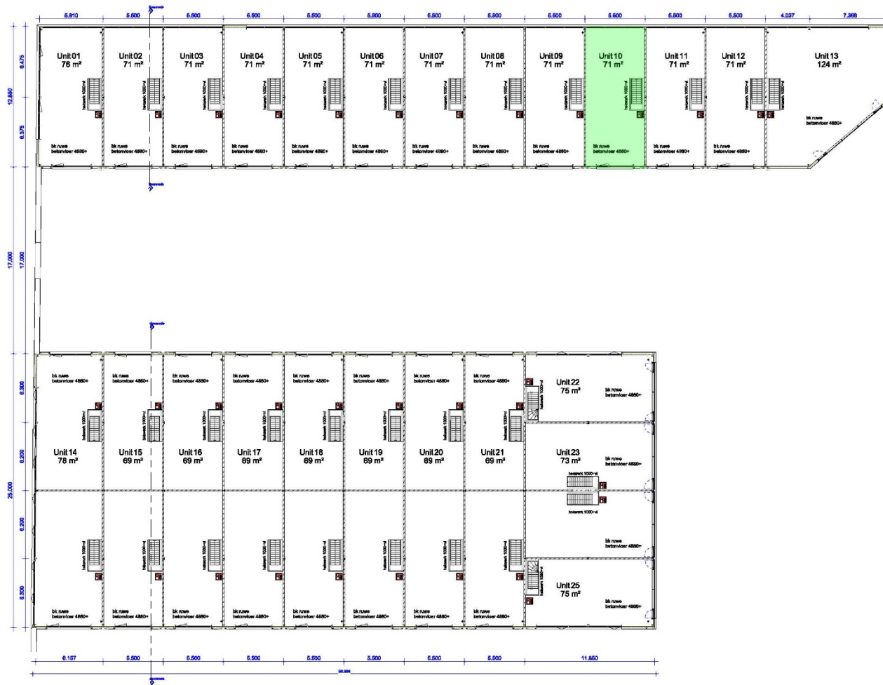
Verdieping fase 1 1:100