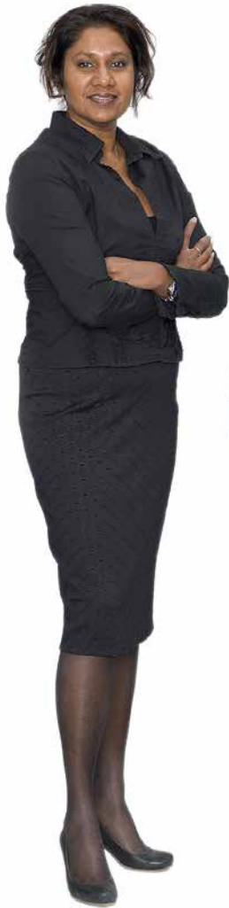
U. (USHA) BOEDHOE RT RM