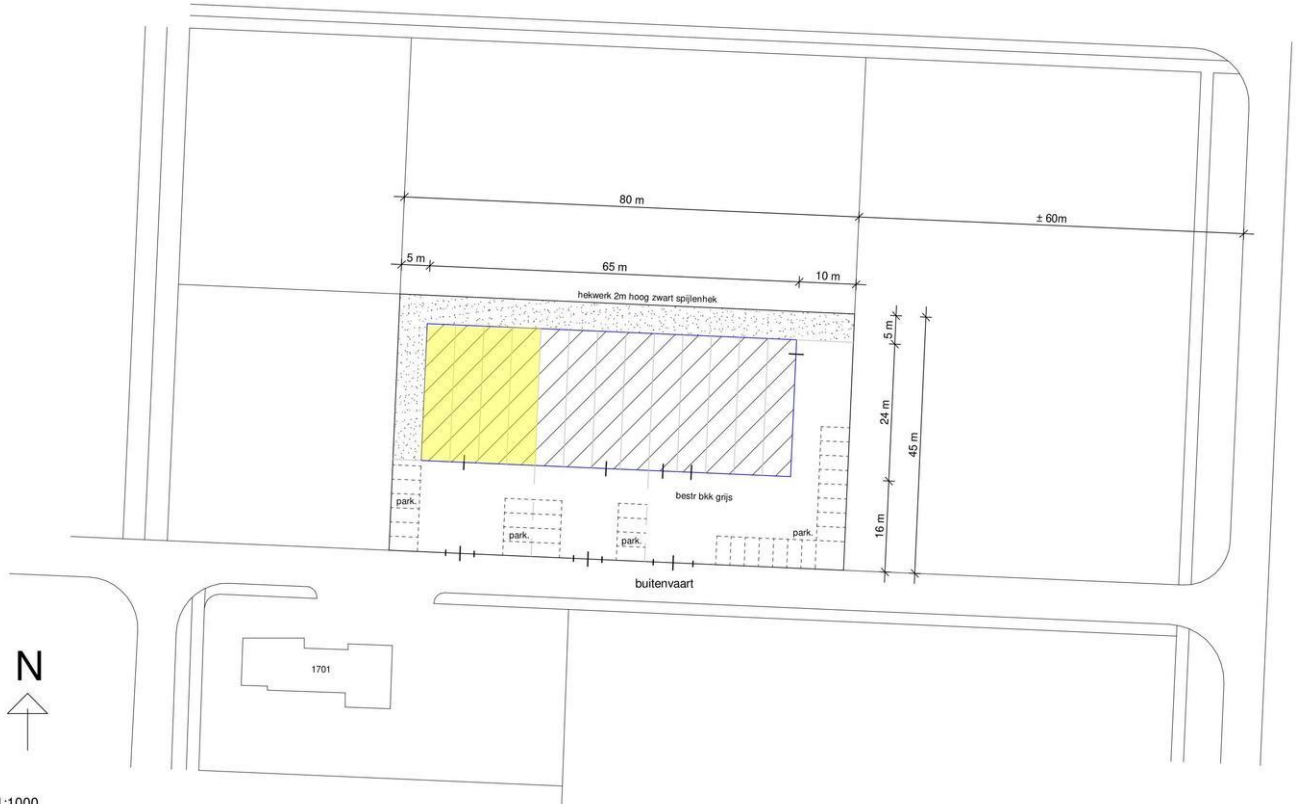
Situatie 1:1000 gem. Hoogeveen sectie D no 6015 ged.