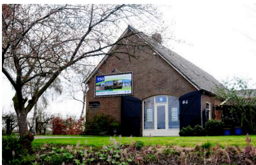
Ons kantoor in Marknesse