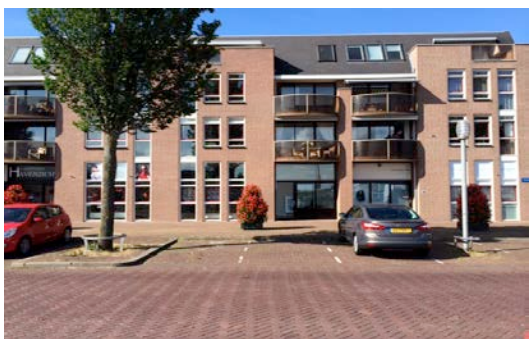
Ons kantoor in Almere

VSO makelaars & taxateurs is op de particuliere en zakelijke markt actief op het gebied van makelaardij.