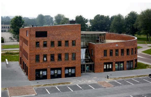
Ons kantoor in Dronten

Industrieweg 39-41, Kampen VSO makelaars & taxateurs