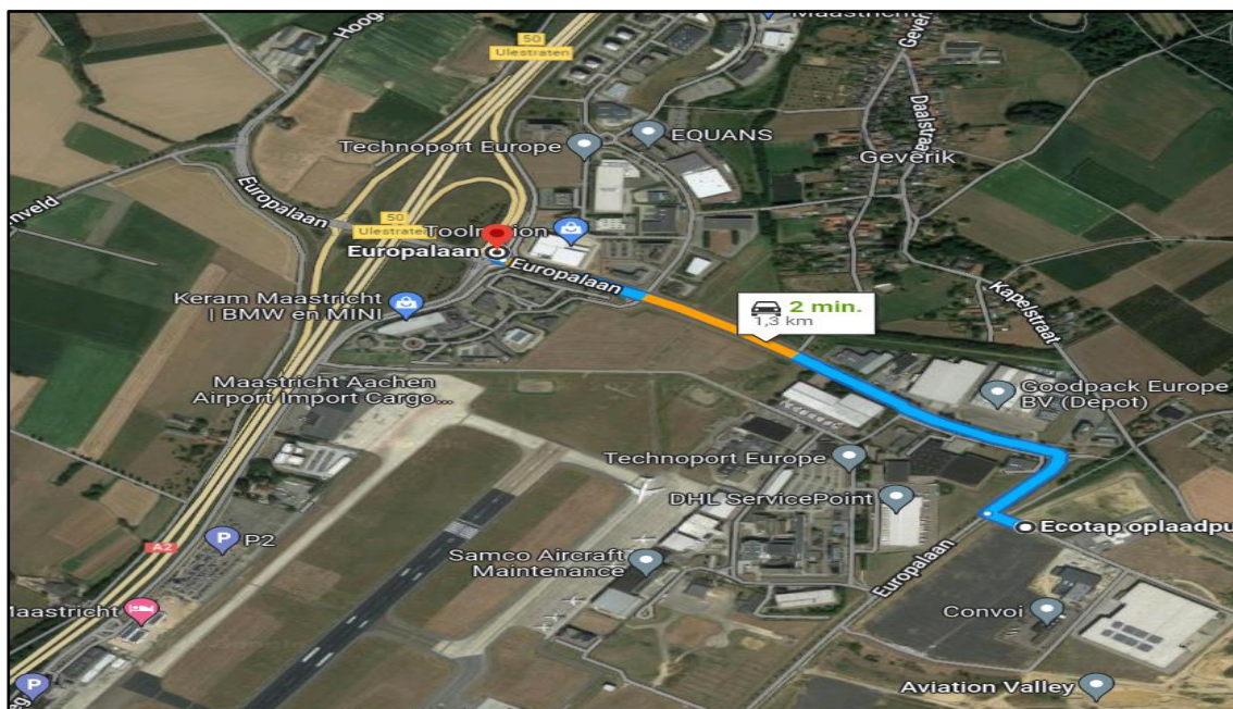
Ligging naast MAA en rijafstand tot de snelweg A2 (Maastricht - Eindhoven - Amsterdam).

Noemenswaardig is dat Aviation Valley niet alleen uiterst centraal binnen de regio Zuid - Limburg (ca. 600.000 inwoners) gelegen is, maar tevens pal naast de start- en landingsbaan van Maastricht Aachen Airport, hetgeen kansen biedt voor ondernemingen die luchthaven gebonden activiteiten verrichten, waaronder luchttransport.