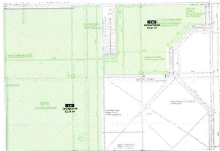
1 e verdieping