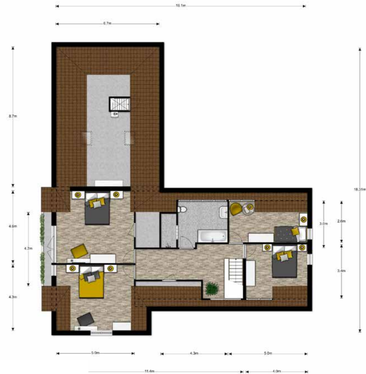
1e Verdieping, Rietgoorsestraat 56 te Rosendaal De plattegronden zijn geproduceerd voor promotionele doeleinden en ter indicatie.