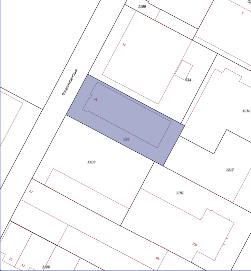
Kadastrale gemeente: Tilburg Sectie: U Perceel: 535