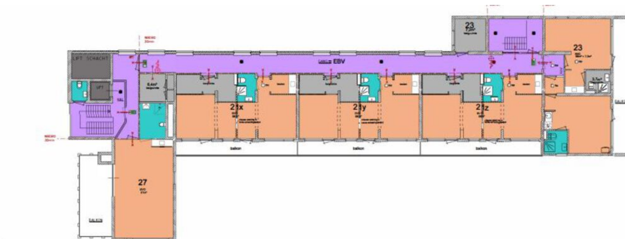
5e verdieping NIEUW