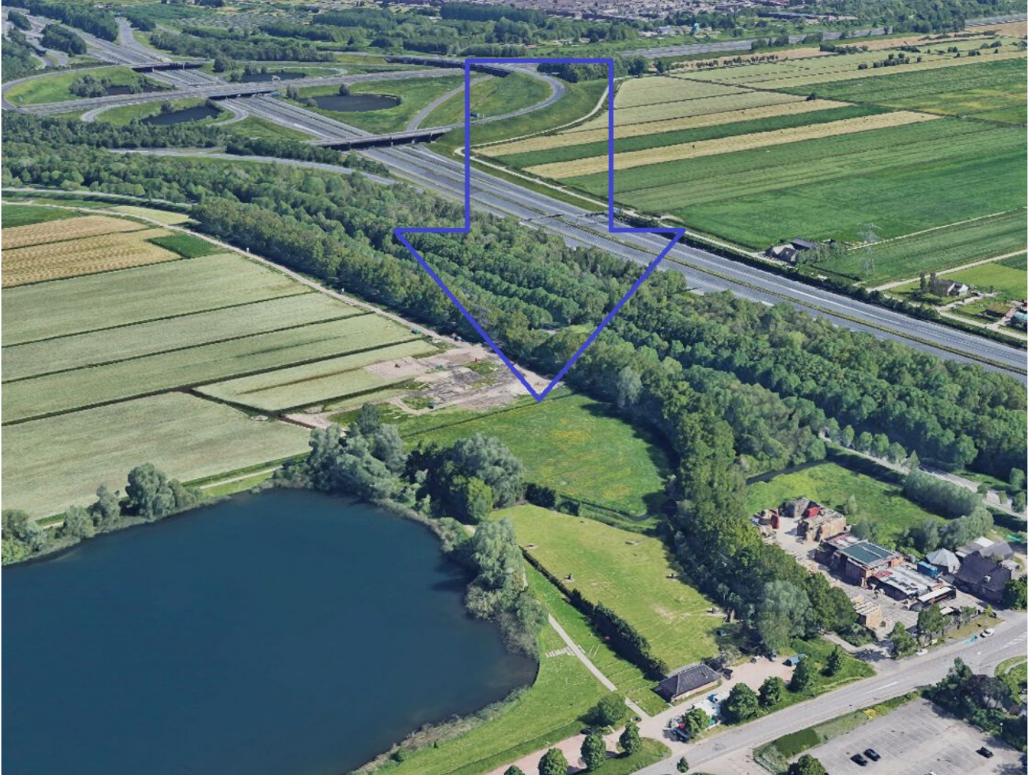
bestaande situatie | locatie