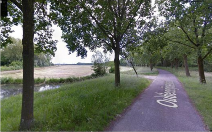
Kavel 13 Strijkviertel | Bolton Groep Woerden | VOCLUS architecten bna | 1055-ut | 06.06.2024