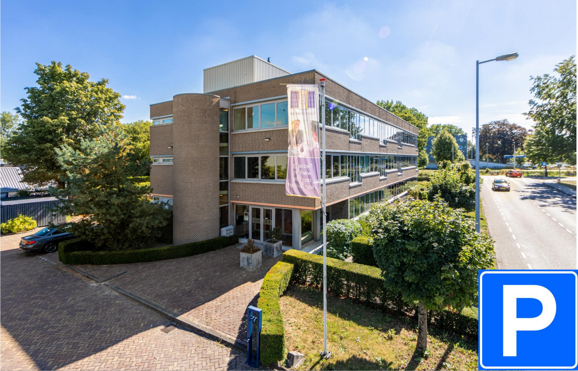
Parkeerplaatsen Wijkmeerstraat 3-7 Hoofddorp