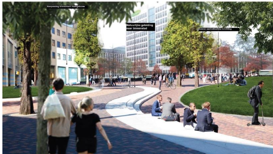
Impressie toekomstig Stationsplein