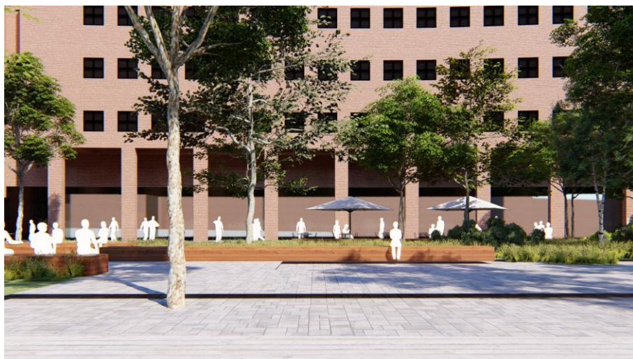
Impressie toekomstige Stationsgebied