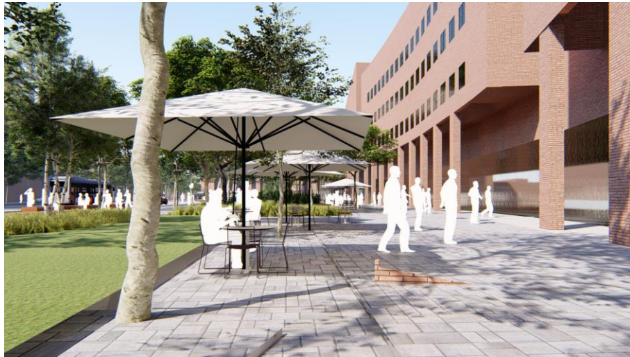
Impressie toekomstige Stationsgebied