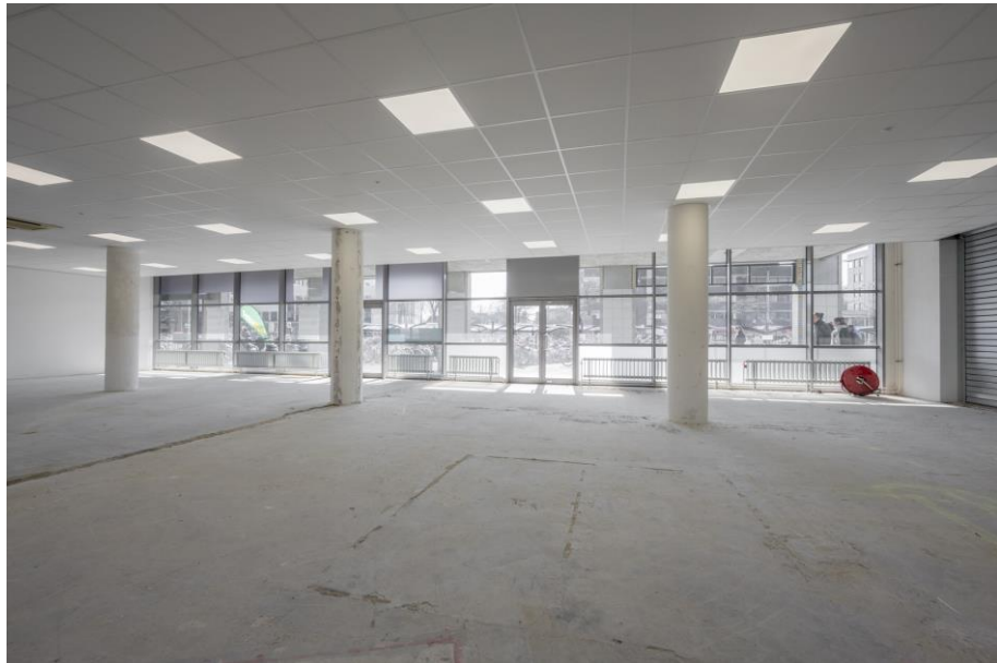
Retail - Horeca ruimte op de begane grond