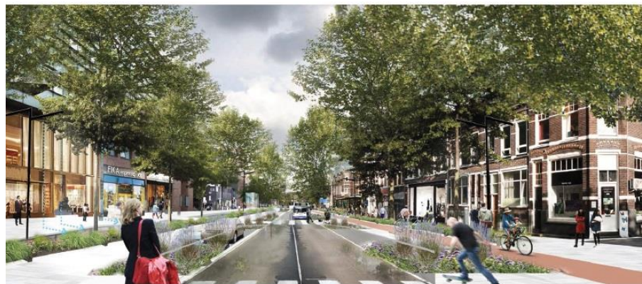
Impressie toekomstige Stationsstraat