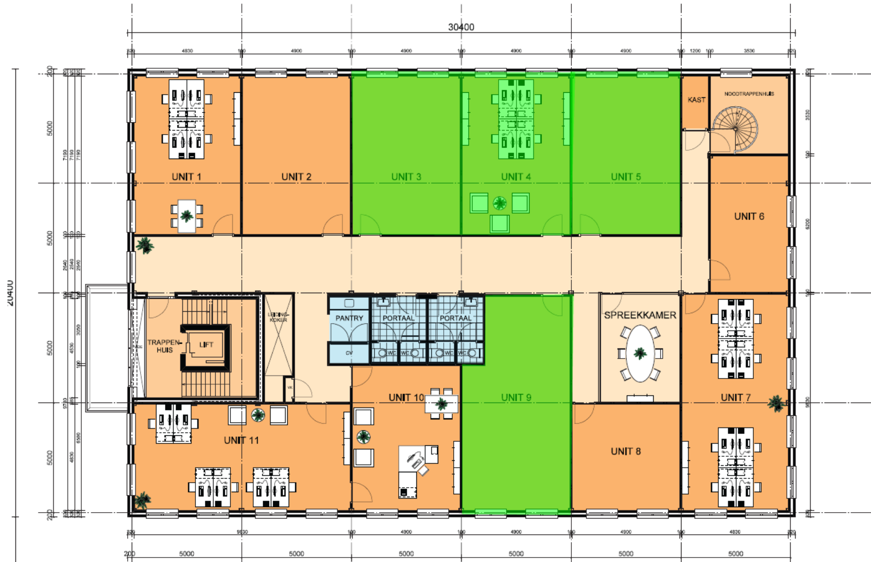
w 1e VERDIEPING