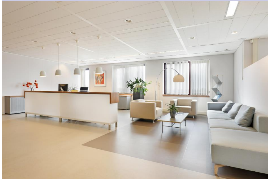
Sfeerimpressie van een verdieping in het gebouw