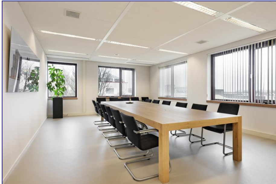
Sfeerimpressie van een verdieping in het gebouw