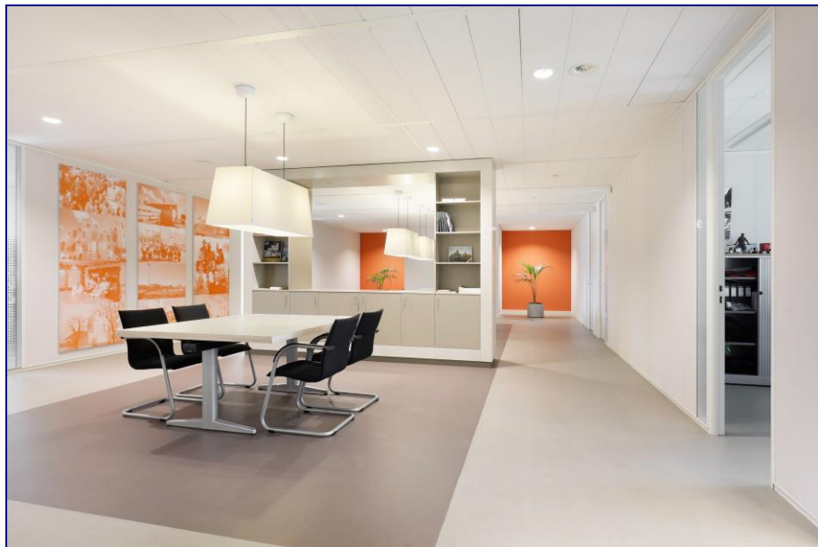
Sfeerimpessie van een verdieping in het gebouw