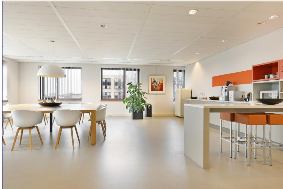
Sfeerimpessie van een verdieping in het gebouw