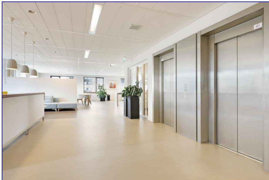
Sfeerimpressie van een verdieping in het gebouw