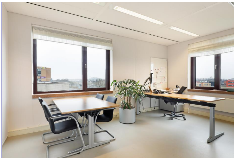
Sfeerimpessie van een verdieping in het gebouw