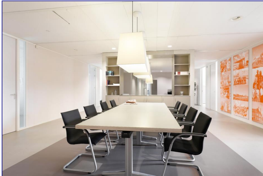
Sfeerimpessie van een verdieping in het gebouw