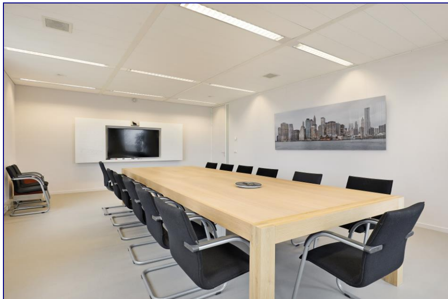
Sfeerimpressie van een verdieping in het gebouw