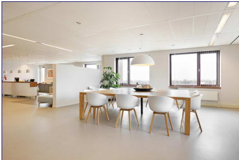
Sfeerimpressie van een verdieping in het gebouw