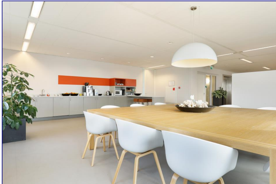
Sfeerimpressie van een verdieping in het gebouw