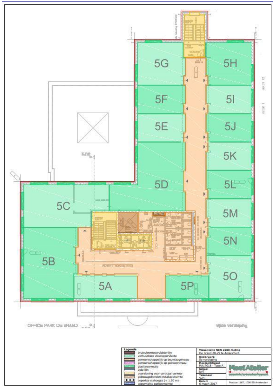
Plattegrond vijfde verdieping