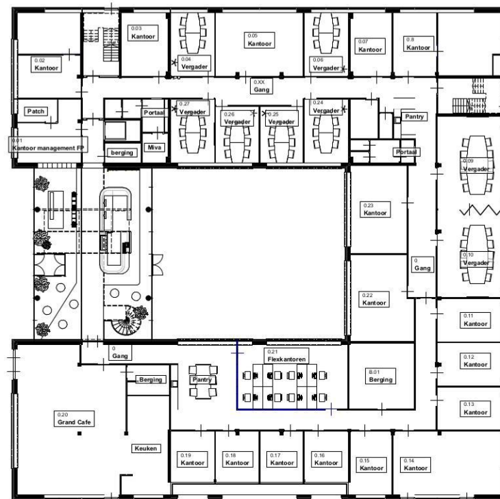
03.1 plattegrond begane grond