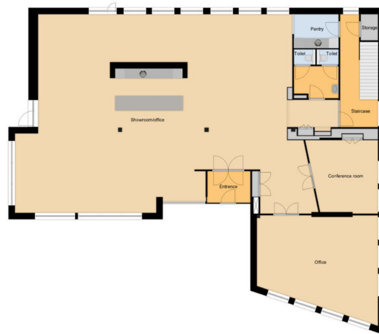
Tower 2 Ground floor