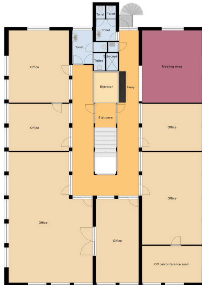
Tower 1 Second Floor