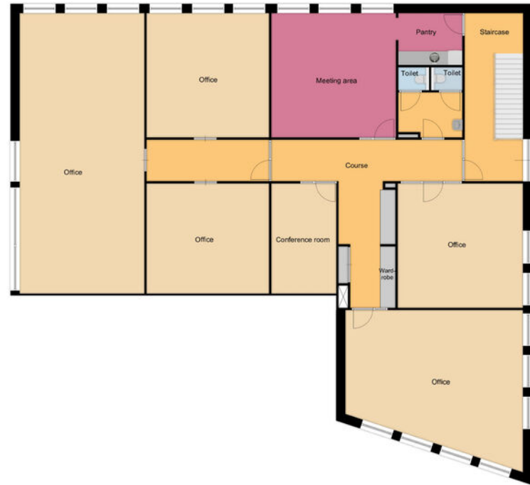
Tower 2 First Floor