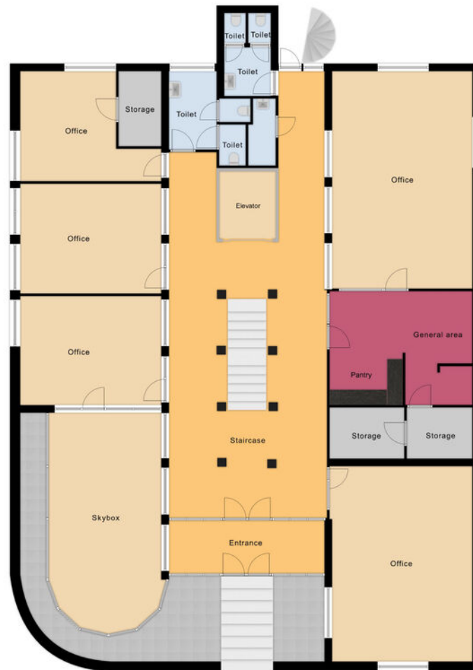
Tower 1 Ground Floor