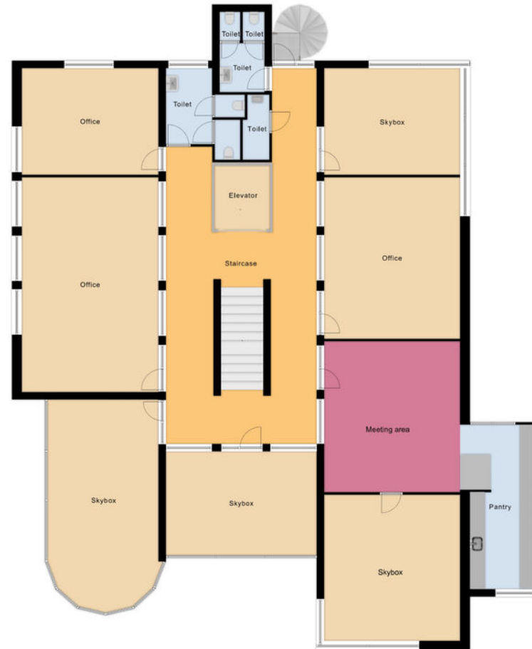
Tower 1 First Floor