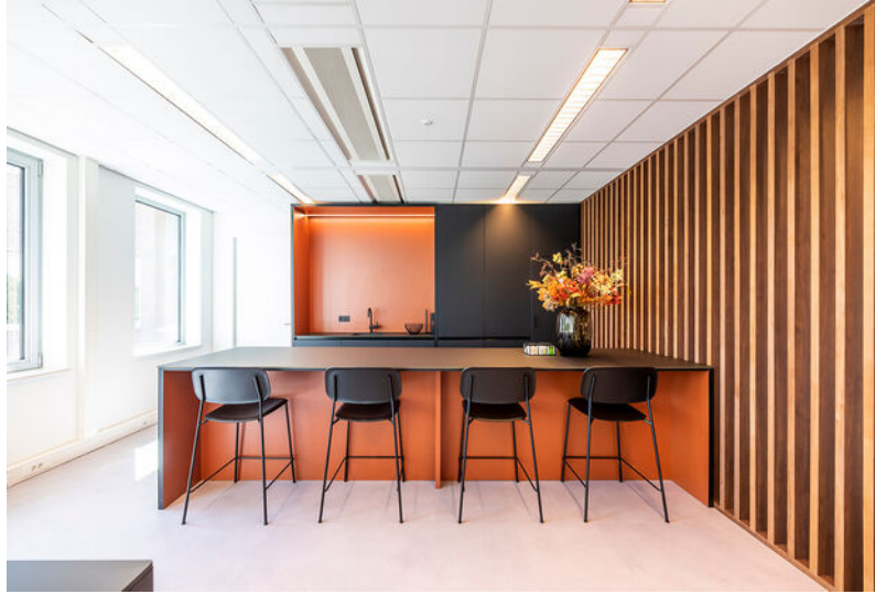
Impressiefoto's eerste verdieping