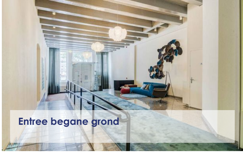
Entree begane grond