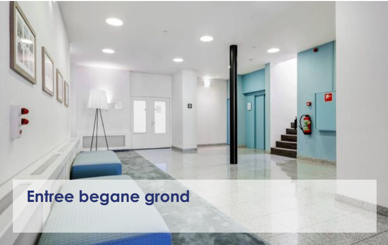
Entree begane grond