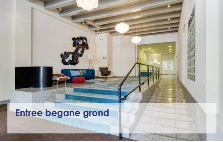
Entree begane grond