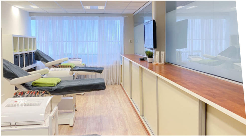
Optie: Overname afslankstudio