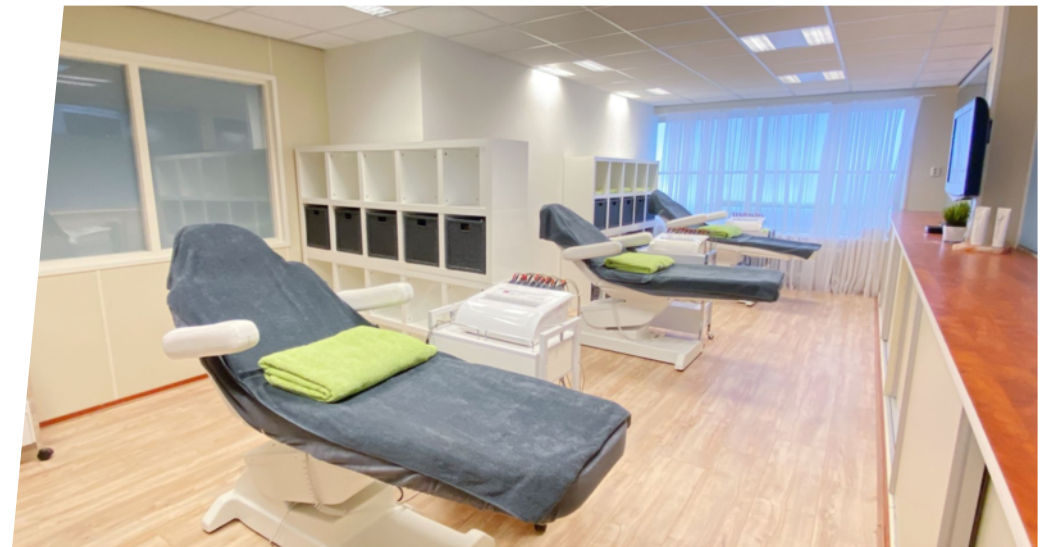
Optie: Overname afslankstudio