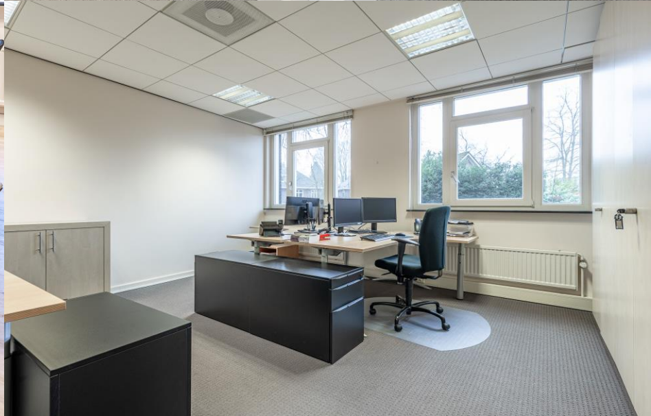
Parklaan 81a, Eindhoven