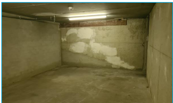
Impressies van het souterrain