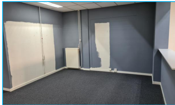
Impressies van de commerciële ruimte.

De ruimte wordt 'as is as seen' en bezemschoon aangeboden, maar voorziet wel reeds in een systeemplafond met LED-verlichting, airconditioning, pantry, toiletfaciliteit, alarm, gas, water- en elektra-aansluitingen, IT-voorzieningen, enz. Het geheel maakt hierbij een verzorgde indruk.