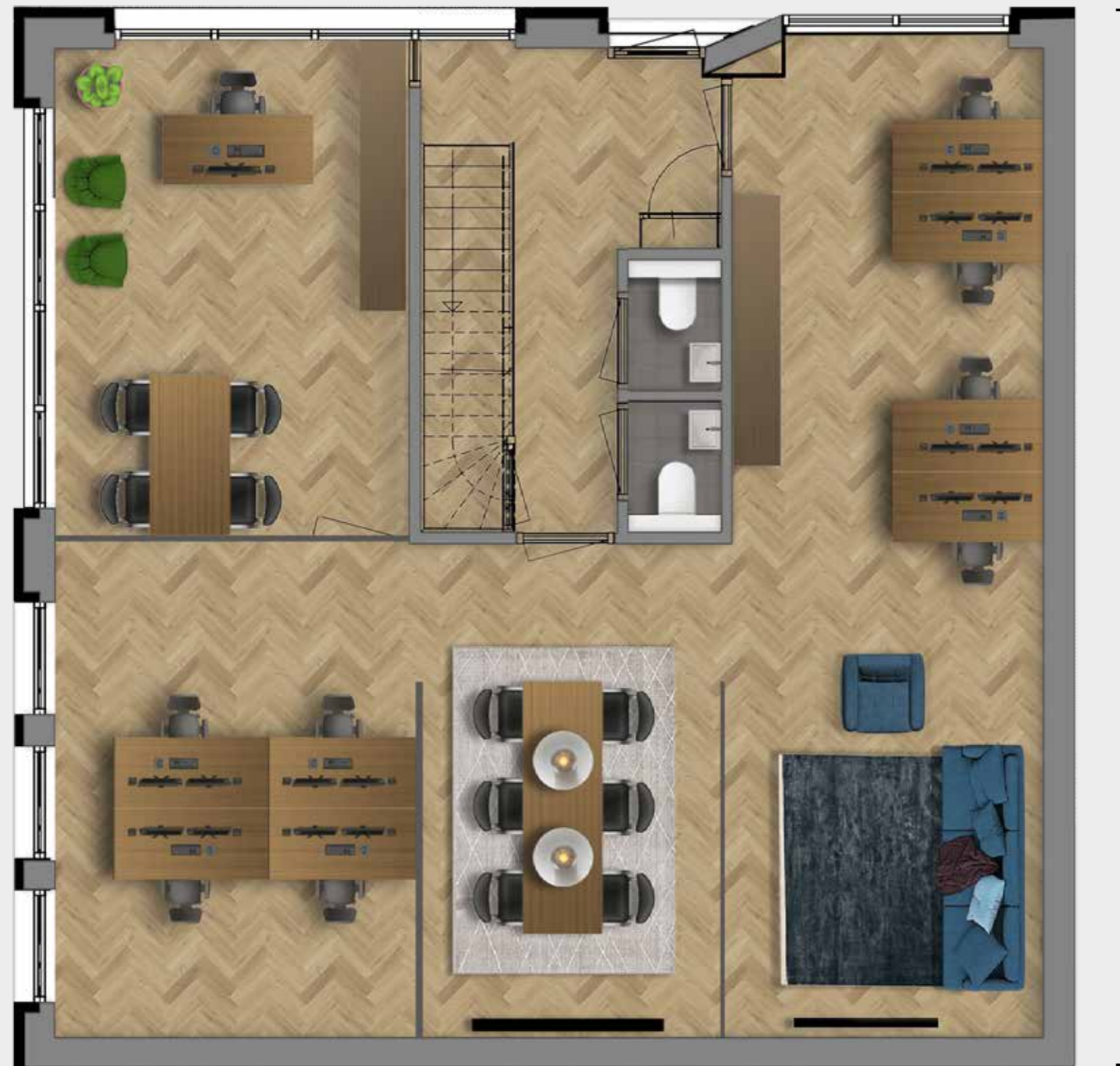
Voorbeeld indeling kantoor 8