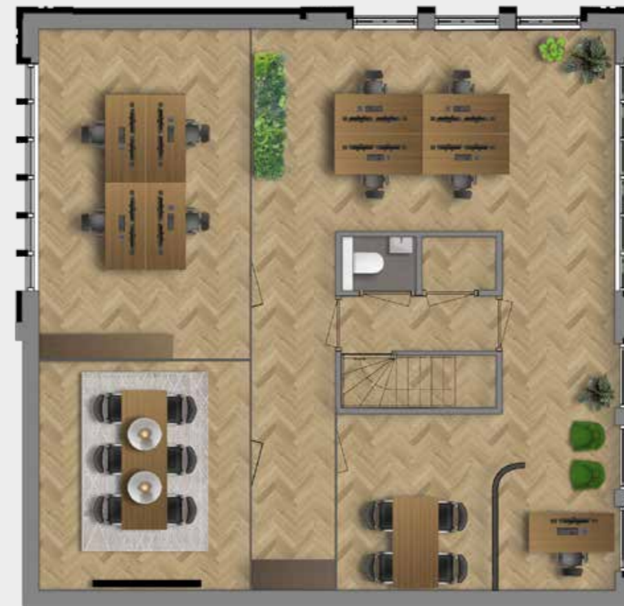
Voorbeeld indeling kantoor 6