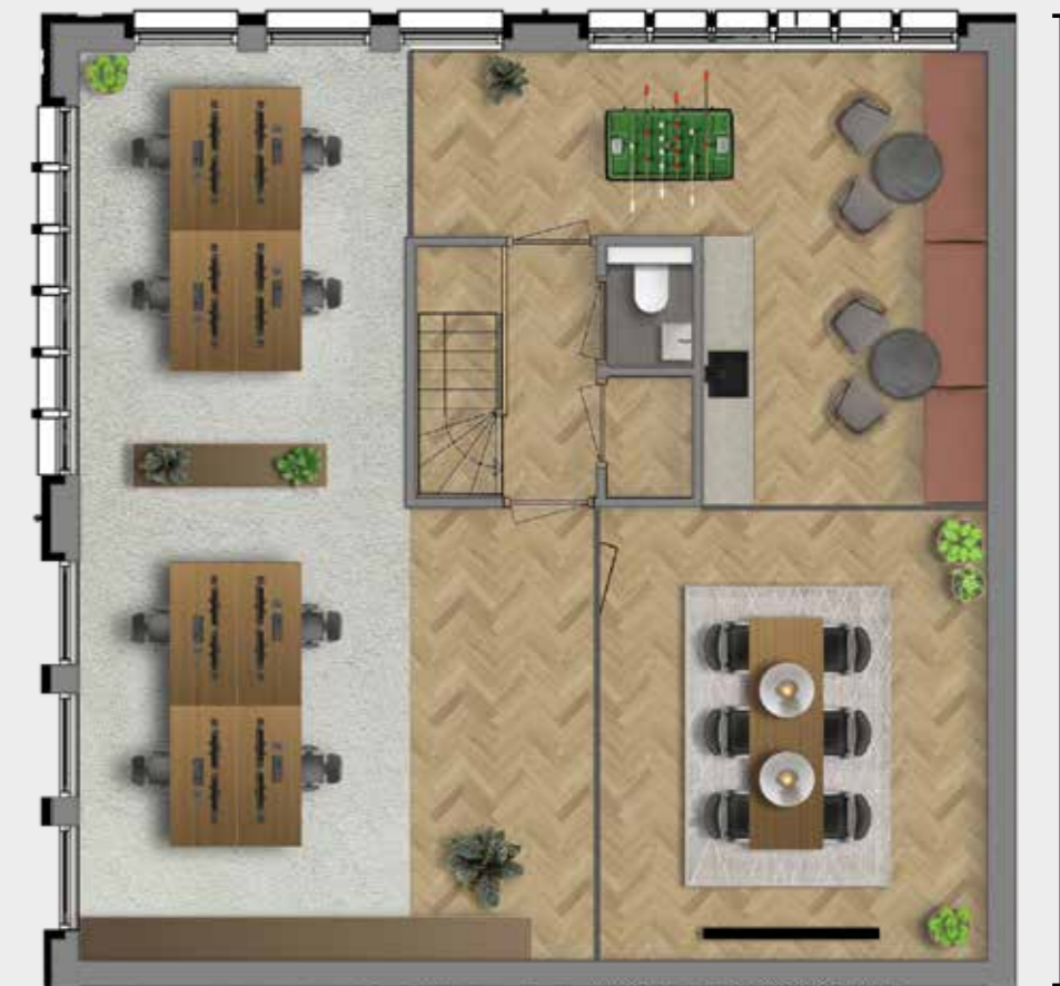
Voorbeeld indeling kantoor 8