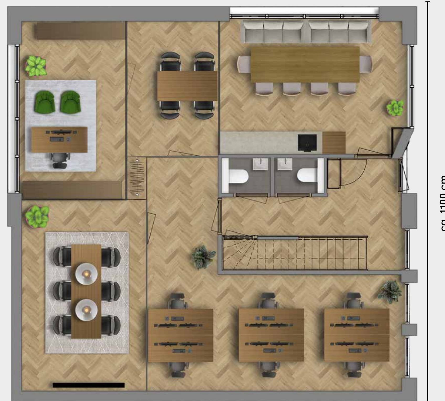
Voorbeeld indeling kantoor 6

Ook is er rekening mee gehouden om de verdieping separaat van de begane grond te gebruiken, bijvoorbeeld voor verhuurmogelijkheden.