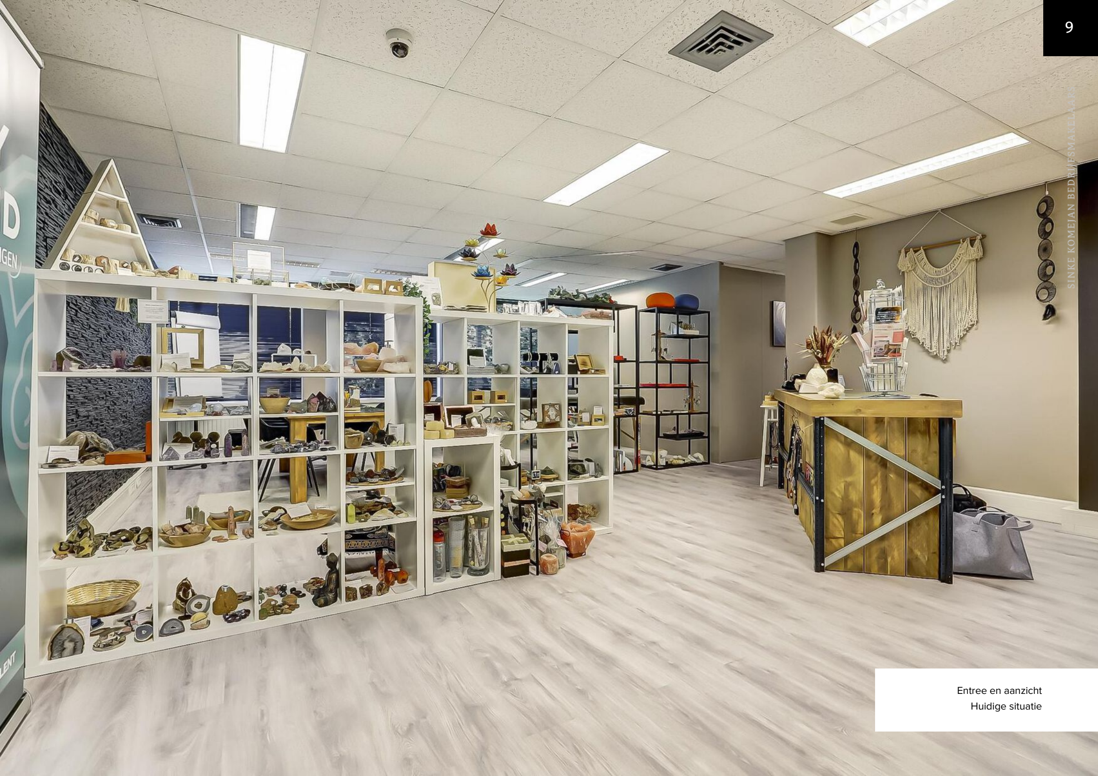
Entree en aanzicht Huidige situatie