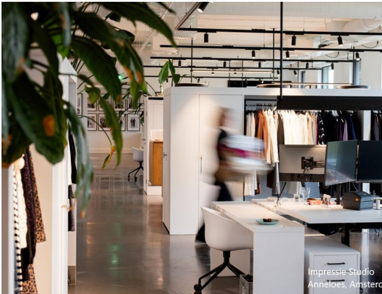
Impressie Studio Anneloes, Amsterd