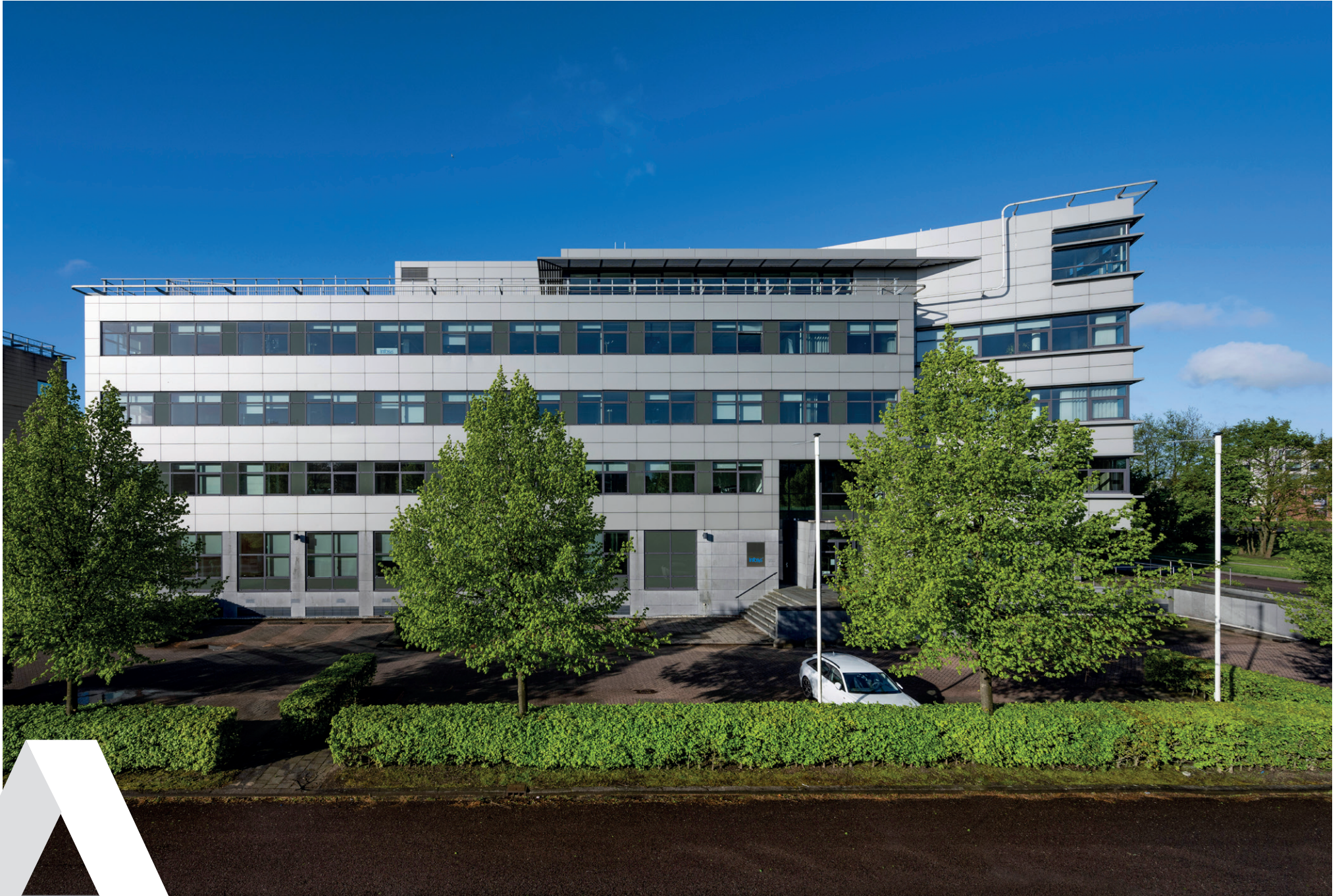
CHICAGO - BOEINGAVENUE 223 - 239