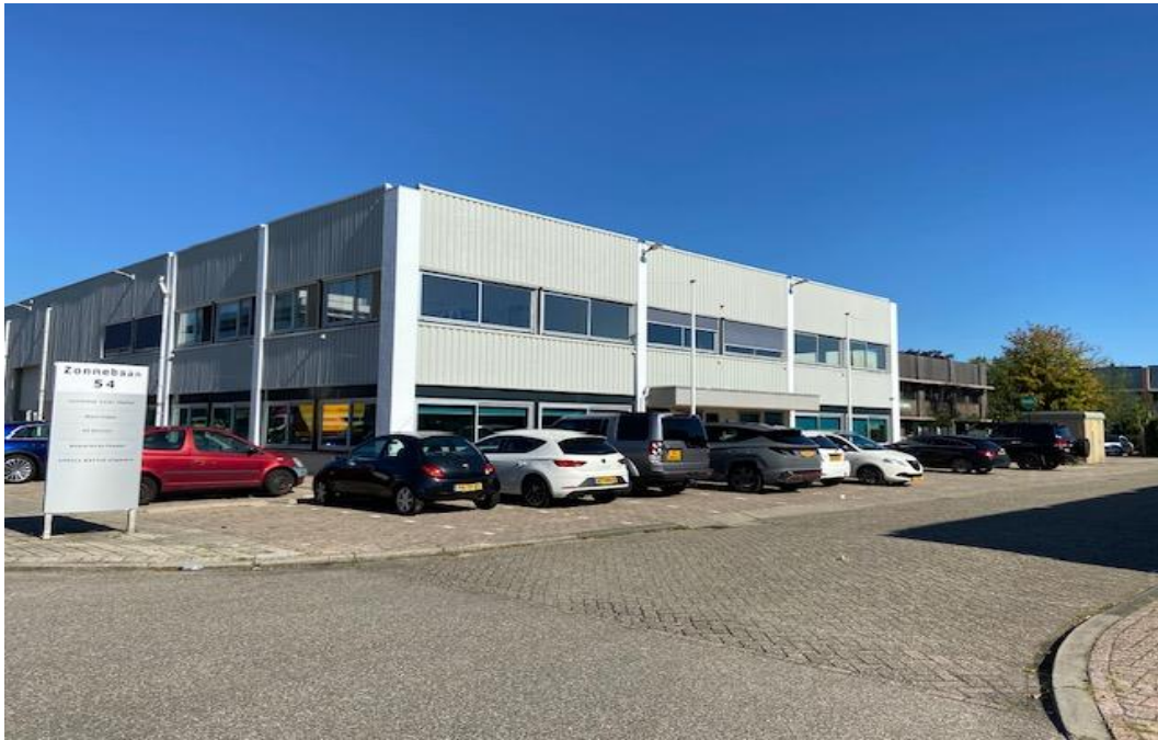
Zonnebaan 54 te Utrecht Art Impression