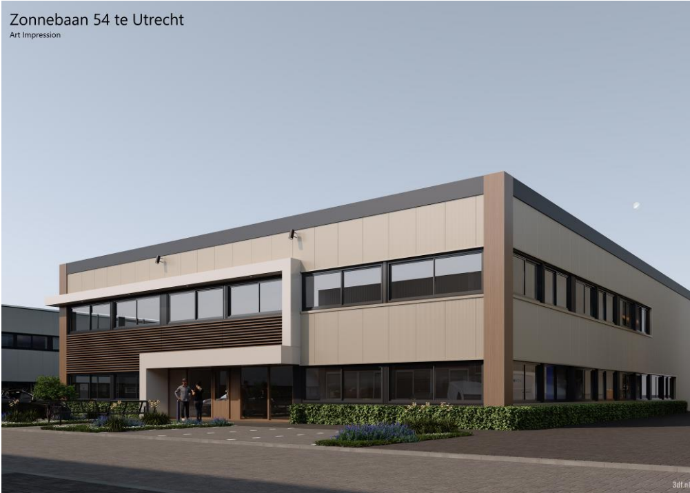
Zonnebaan 54 te Utrecht Art Impression